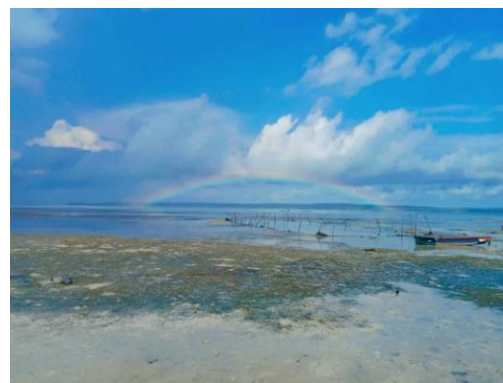
Gambar 3. Kondisi Pasang Dan Surut Di Lokasi Penelitian